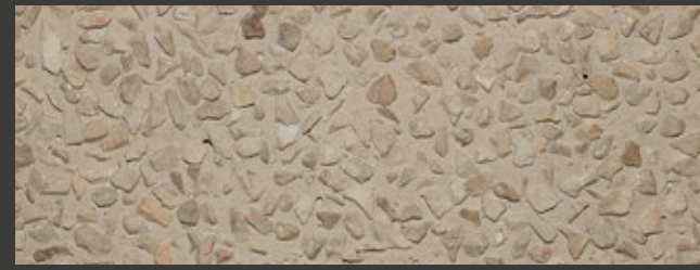
PAGLIA + GREY + AURORA