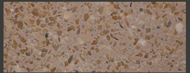
CAMMELLO + WHITE + GIALLO SIENA