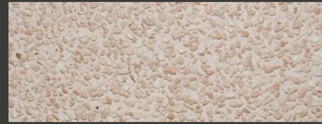
SABBIA + WHITE + ROSA CORALLO