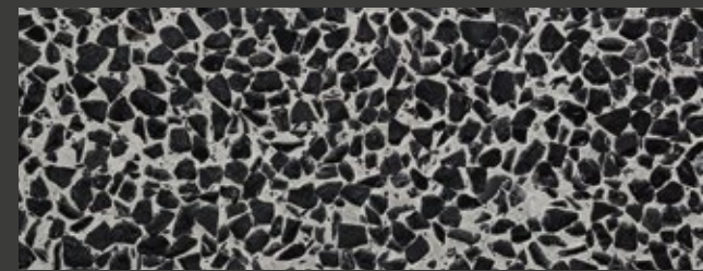
NEUTRO + GREY + NERO EBANO