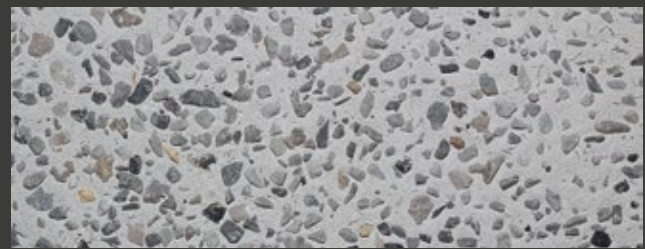
GRIGIO + WHITE + OCCHIALINO