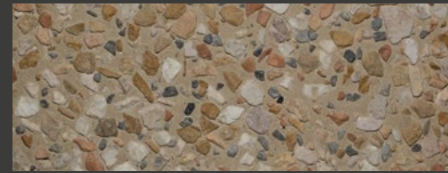
PAGLIA + WHITE/GREY + MIX: GIALLO MORI / BIANCO ZANDOBBIO / ROSSO VERONA / BARDIGLIO