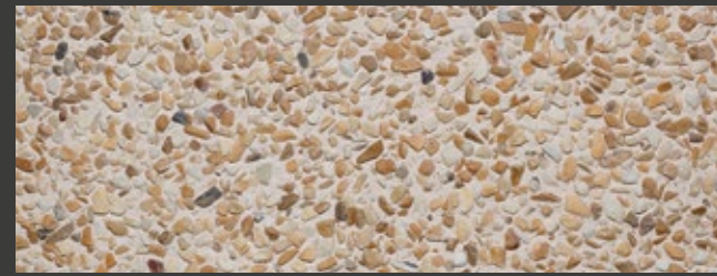
SABBIA + WHITE + GIALLO SIENA