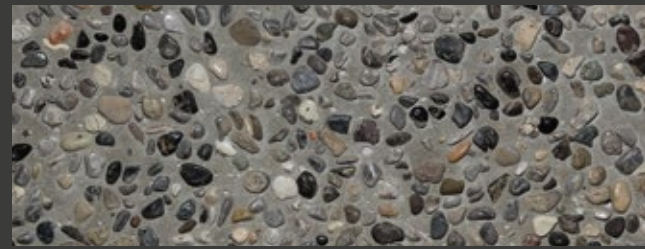
NEUTRO + GREY + BREMBO