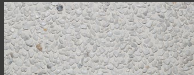
NEUTRO + WHITE + CARRARA