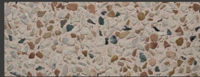
SABBIA + WHITE + ORIENTALE / BOTTICINO