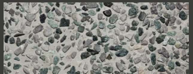
NEUTRO + GREY + VERDE ALPI