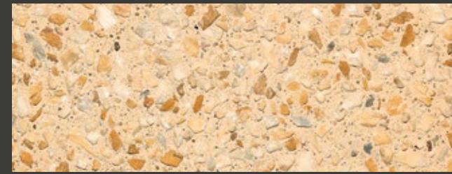
PAGLIA + WHITE + GIALLO SIENA