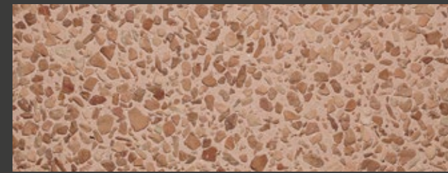
TERRA TOSCANA + WHITE + ROSSO VERONA