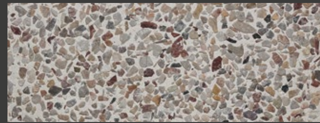
TORTORA + WHITE + ARABESCATO