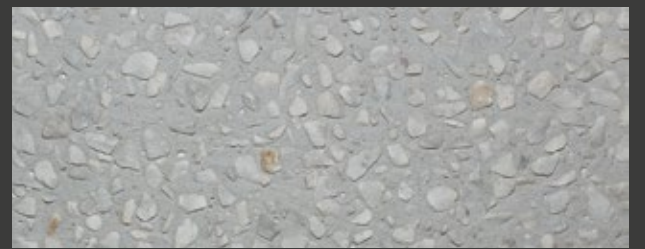
NEUTRO + WHITE / GREY + CARRARA