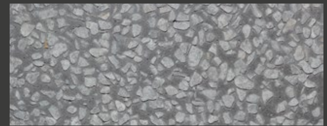
ANTRACITE + GREY + CARRARA