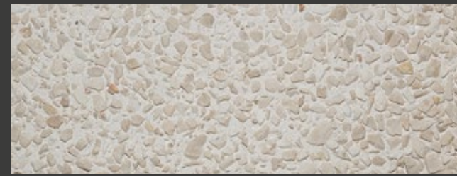
TORTORA + WHITE + BOTTICINO