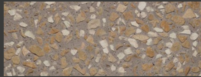
CAMMELLO + GREY + GIALLO ORO / BOTTICINO